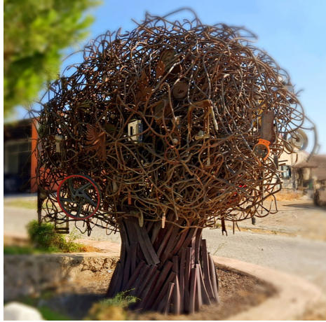
Sanayi Ağacı, 2021

Sanayi'deki yüzden fazla usta esnafla tek tek görüştüm. Her birinden kullandıkları bir el aletini istedim. Bir kâğıda kendi el yazılarıyla isimlerini yazmalarını da. O yazıyı aldığım el aletlerinin üzerine kazıdım. Sonra o demir yumağına bir ağaç gövdesi yaptım, el aletlerinin üzerine ustaların isimlerini kazıdım ve onları ağacın tacı kabul ettiğim demir yığına meyve gibi astım. Bütün ustalar tek bir ağaçta bir araya geldiler. Aralarından ölmüş olanların meyvelerini ağacın dibine düşürdüm. Üstündeki ustaların meslek hayatlarının toplamının iki bin yıldan fazla olduğunu fark ettim. Bu beni çok şaşırttı. Ağacın yaşı budur dedim.