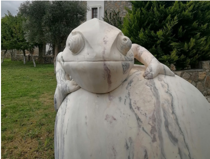
Bukalemun, 2014

bitirebilseydim parkın taş örgü duvarlarını dalgalandırıp tümsekler yaratacaktım. Tümsekleri içeri doğru oyacak ve buradan, yeraltından bize bakan hayvan gözleri işleyecektim. Sizin bu gözlerden ürkmeye gerek yok. Asıl bizden korkan bu hayvanlar; geçip giden insan kalabalığını saklandıkları yerden kaygıyla seyretmekte olacaktı.