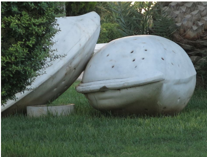
İki Badem, 2009

Bu şiir beni ikna etti. Ben de bu İki Badem heykeli, Datça girişinde Jandarma kavşağında bulunuyor.