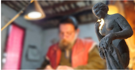
'The ubiquity of Aphrodite modelleme çalışması', 2023

Afrodit'i çıplak bir kadın figürüne hiçbir zaman indirgemedim ben. Onun bende yarattığı etkileri betimlemem zor. Çok zor. Anlatmakla bitiremeyeceğim bir serüvene doğru yola çıktım ben. Bir taraftan o heykele kavuşmak isterken, bir taraftan da beni bitiren merakın ateşindeyim. Afrodit uğruna anlatılacak çok şey var. Belki de kadına dair her şeyi, yani aşka ve yaşama dair her şeyi anlatmak gerekiyor. Bu da mümkün olmayan bir çokluk. Datça Afrodit'i düşünen bir kadın olacak. Bunu The ubiquity of Aphrodite , yani 'Afrodit'in Her Yerdeliği' adını verdiğim heykel için de söylemişim. Neden düşünen? Neyi düşünen? Nasıl düşünen? Benim bunlara verilebilecek çok cevabım var. Ama hepsinin yetersiz olduğunu biliyorum. İsteğim kadınların bunları bana, bize; bugüne ve geleceğe anlatması.