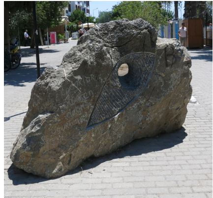
Berkin Elvan Anıtı, 2014

Sonra Gezi olayları oldu. Türkiye’de yer yerinden oynadı. Aramızdan ayrılan Berkin Elvan için bir anıt heykel yapmak istedim. Oyulan gözümüzü, delinen kalbimizi, alamadığımız ekmeğimizi Datça taşına not düştüm. Üzerine de Gezi’nin etkileyici sloganlarından birini kazıdım: Çocuklar ölürken değil, uyurken susulur.