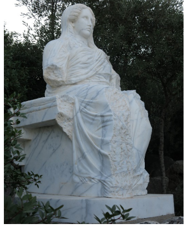
Datça Demeteri, 2010

Peşinden Badem adını verdiğimiz fok balığının heykelini yaptım. Datça kıyılarında çok zaman geçiren Badem, birçok tatlı hikâye kattı hayatımıza. Plajlarda köpekler ve denizde insanlara yaptığı şakalarla Datça'nın unutulmaz karakterlerinden biri oluverdi. İnsanlara çok yaklaşan hayvanlar yaşam riski taşıyordu bence. Badem için çok kaygılandı-