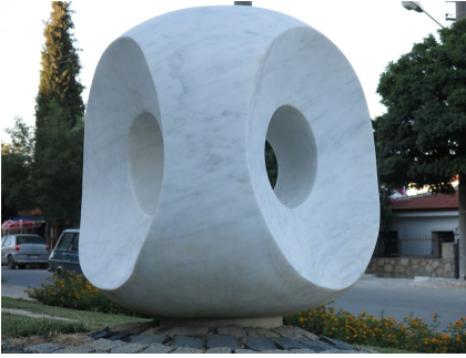
Nazar Taşı, 2013

Datça Limanı'nda bulunan Fok Balığı Badem kasabamızın heykeldir.