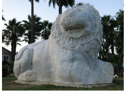
Datça Aslanı, 2006