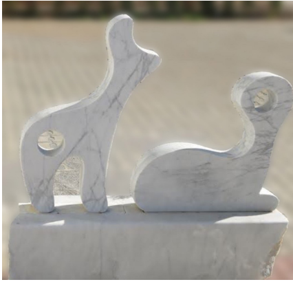
Kuyruksuz Köpekler, 2015

Parantezi kapatıp kasabanın heykellerine devam edelim.