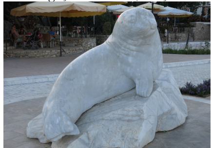
Fok Balığı Badem, 2012