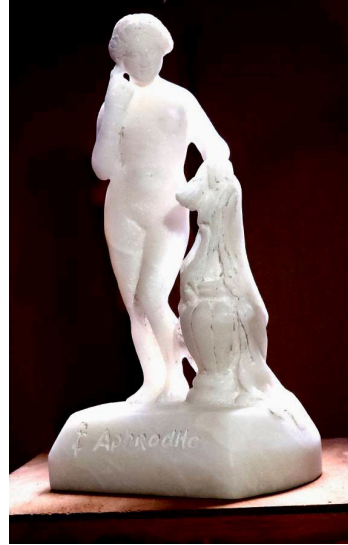
The ubiquity of Aphrodite, 2024, Foto: Cem Bal

İlk etkinliğimiz The ubiquity of Aphrodite adlı heykelimle ilgili oldu. Yaptığım, 20 cm boyutunda mermerden bir Afrodit heykelciğini Mars'a ulaştırılması umuduyla Space X'e gönderdim. Bununla Mars'ta insan kolonileşmesinin aşksız, yani onun temsilcisi Afrodit'siz olmayacağını iddia etmek istedim.