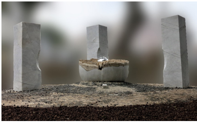
Fikir Sağlığı , 2021

Şimdi kasabamızın yüzyıllardır kayıp olan Afrodit heykelini yapma niyetindeyim. O da kasabanın heykeli olacak. Knidos Aslanı, Knidos Demeteri ve Knidos Afroditini benim için Datça’nın üç önemli simgesidir. Liman’da Datça Demeteri, Datça Aslanı’na doğru bakar; Aslan, Afroditini